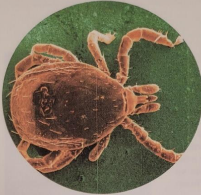
Tique Ixodes (image colorisée).