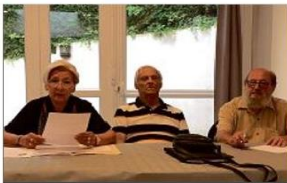
BILAN. Aide et répit conseille et accompagne les aidants afin de garder les malades le plus longtemps possible à leur domicile.

Le 16 février 2022, les clubs services du Rotary Chaîne des puits et le Lions club Clermont doyen ont remis à l'association un chèque de