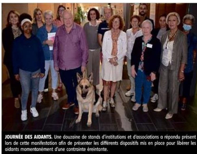
Photo de certains participants à la journée des Aidants

En partageant les bienfaits de la danse, j'espère vous inspirer à embrasser la danse comme une source de vitalité tout au long de votre vie